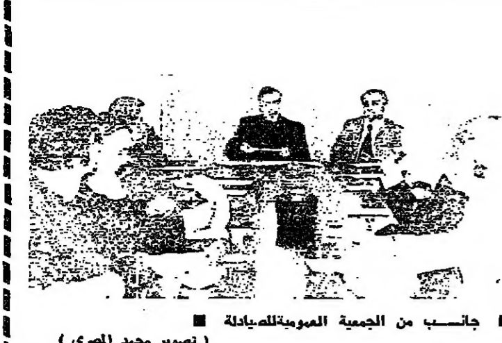
جانسب من الجمعية العمومية للصيادلة